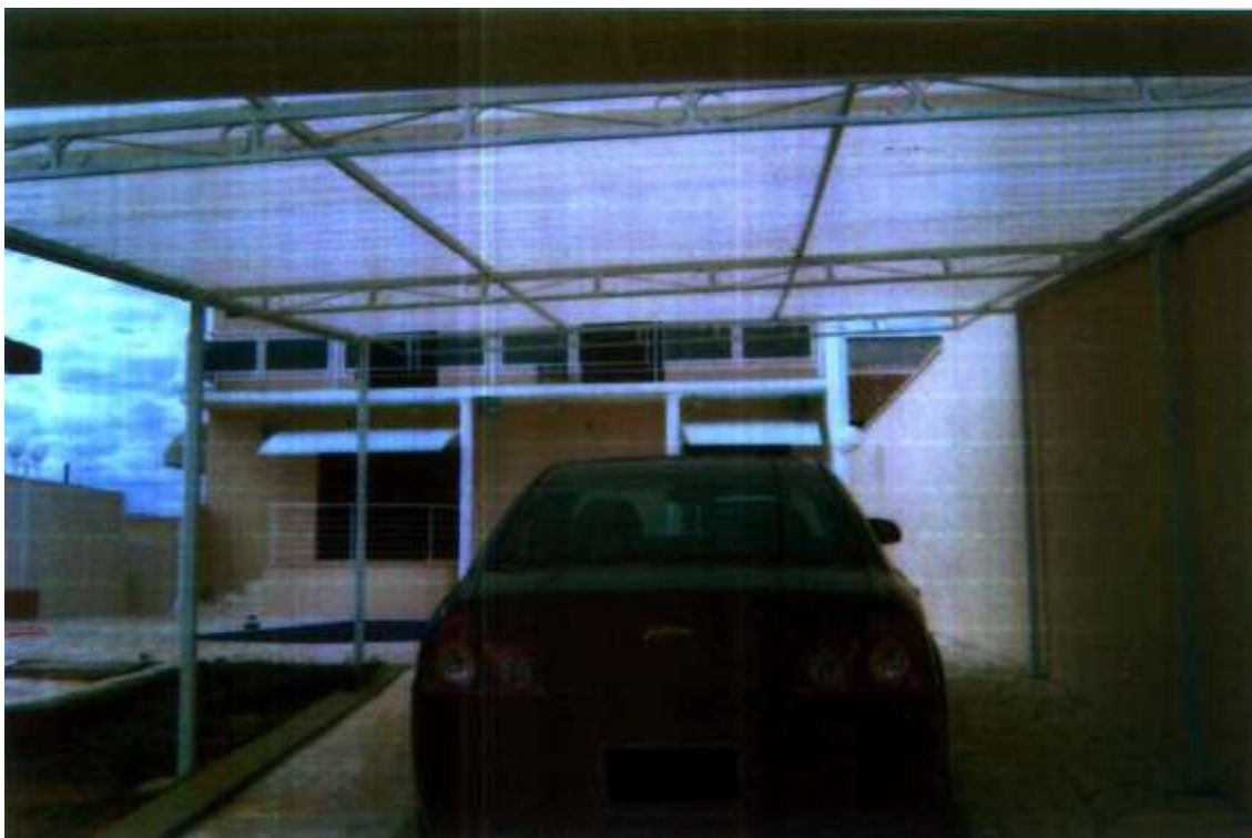
COBERTURA TIPO TÚNEL – FIBRA DE VIDRO