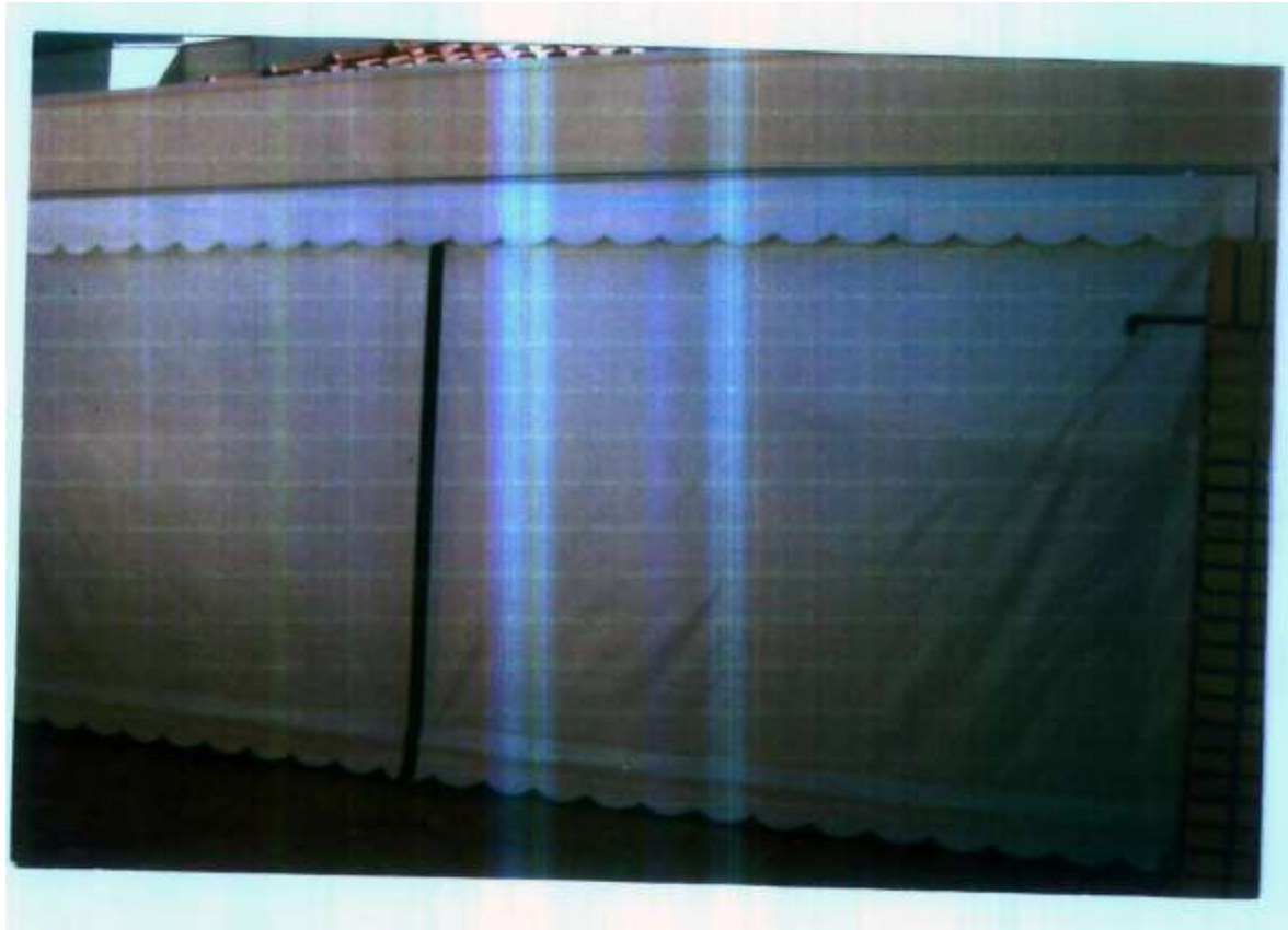
TOLDO RETANGULAR FIXO