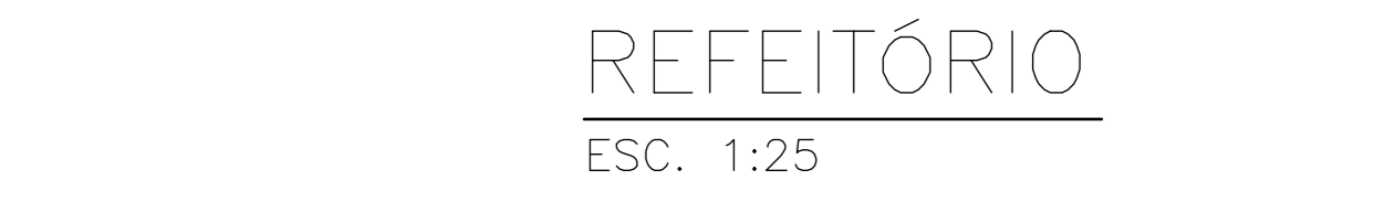
REFEITÓRIO ESC. 1:25

NOTAS MATERIAL DAS TUBULAÇÕES AF - PVC BACIA SANITÁRIA COM VOLUME DE DESCARGA REDUZIDO (VDR-6LITROS). LAVATÓRIO COM TORNEIRA DE PRESSÃO C/RESTRITOR DE VAZÃO (MÁXIMO = 6L/MIN.) VÁLVULA DE DESCARGA COM REGISTRO INCORPORADO.