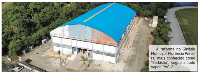
A reforma no Ginásio Municipal Florêncio Pereira, mais conhecido como "Sarkisão", segue a todo vapor. PÁG. 2