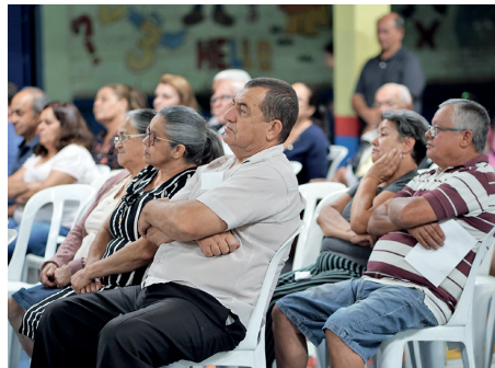
Moradores do Jd. Vaneza estiveram presentes na reunião que aconteceu no último dia 13 de novembro