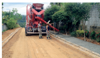
Rua Tenente Valfredo de Oliveira no Jardim Odorico

"Asfalto é muito importante para melhorar a qualidade de vida das pessoas. Evita problemas com o barro em época e chuva e com poeira em períodos secos, além de facilitar o tráfego de veículos. Não tenho dúvidas de que essas obras melhorarão a vida da população que utiliza as vias", disse o prefeito Antonio Aiacyda.