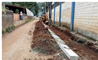
Ruas Aguas Espraiadas no bairro Jundiáizinho