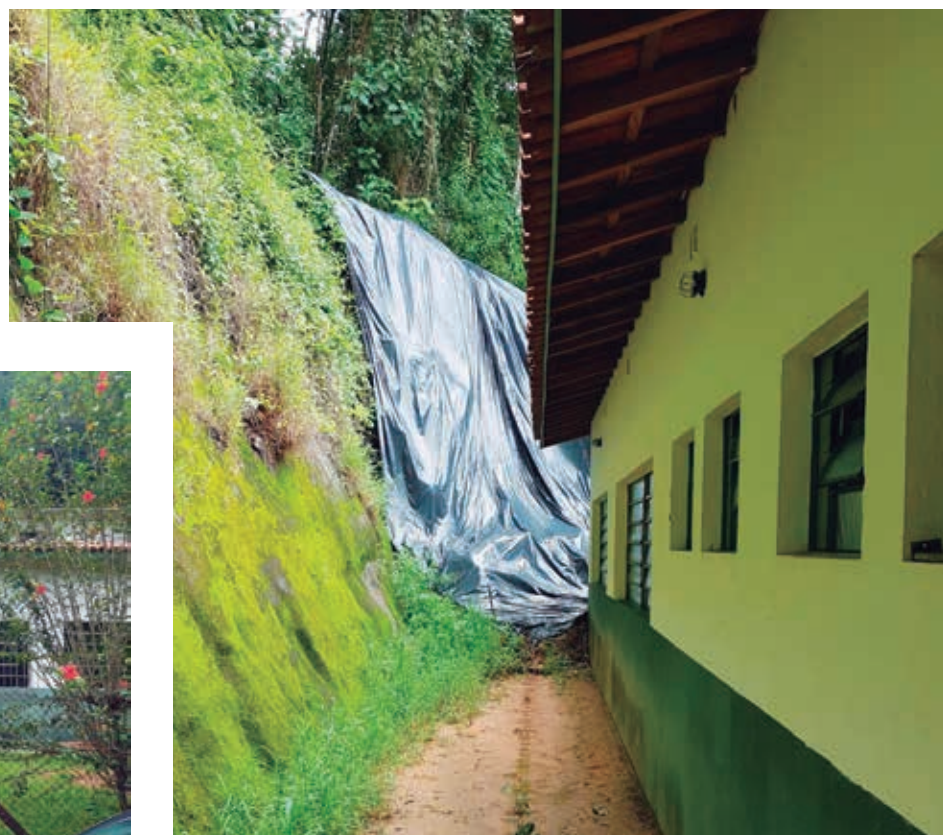
Com deslizamento, terra do barranco encostou na parede de uma das salas de aula