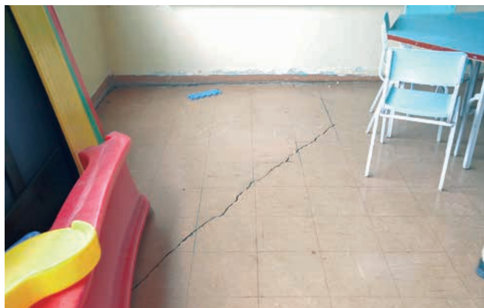
Na foto o piso da sala de aula cedeu

Vale destacar que já existia um processo licitatório aberto para que fossem iniciadas as obras nas escolas, mas a gestão anterior encerrou os mesmos em dezembro, atrasando todo o procedimento neste início de ano.