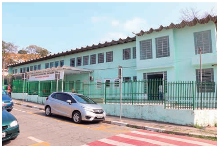
Agendamentos e consultas serão realizados na Unidade Básica de Saúde (UBS)

P ara facilitar a vida da população, a Prefeitura Municipal firmou parceria com Hospital e Maternidade Mairiporã para ampliar os serviços do SUS na cidade. Pacientes que aguardam há anos por pequenas cirurgias como laqueaduras, vasectomias e cirurgias de pequeno porte, já podem realizar o procedimento no Hospital. Os agendamentos e consultas serão realizados na Unidade Básica de Saúde (UBS). PÁGINA 4