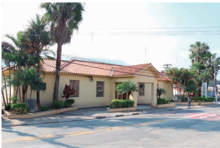
Hospital e Maternidade Mairiporã começa realizar pequenas cirurgias como laqueaduras, vasectomias e cirurgias de pequeno porte

Novas ações da Saúde irão facilitar a vida da população mairiporanense