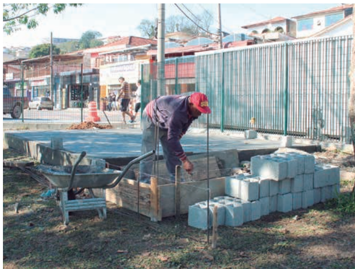
Base que irá sustentar o banheiro container já está quase finalizada. Na próxima semana a equipe da Prefeitura irá fazer a instalação dos banheiros